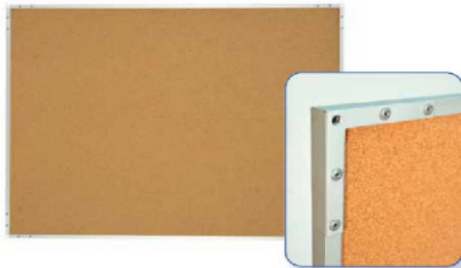
Standard-Tafel 1.200 x 1.000 x 15 mm