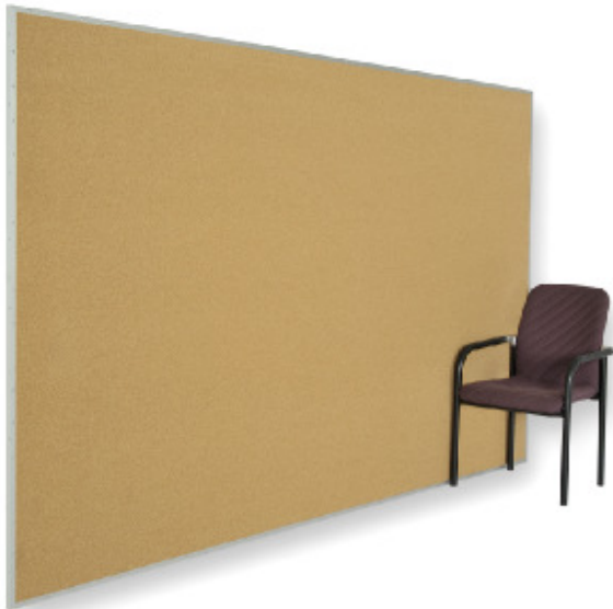
Großtafel 3.000 x 1.800 x 25 mm